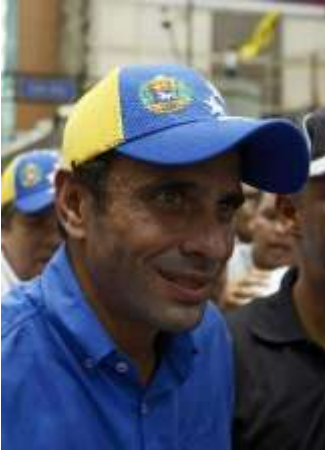
Henrique Capriles, líder opositor.

Oposición impugna resultados electorales en clima tenso -- La oposición venezolana impugnó ayer ante el Tribunal Supremo de Justicia (TSJ) los resultados de las elecciones presidenciales que dieron vencedor al chavista Nicolás Maduro, en medio de un clima de crispación política en el país sudamericano. El grupo afín a Henrique Capriles presentó 3.000 incidencias del día de las elecciones y en días previos.