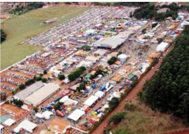
El campo de exposiciones fue renovado y se amplió el área de estacionamiento para la XXI edición de la Expo Santa Rita, que abre sus puertas hoy, a las 9:00.

La XXI Expo Santa Rita abre hoy sus puertas con instalaciones totalmente renovadas. Shows musicales con renombrados artistas y el sorteo de un tractor en el bingo serán los principales atractivos con los que pretenden captar la visita de entre 350.000 y 380.000 personas durante la muestra.